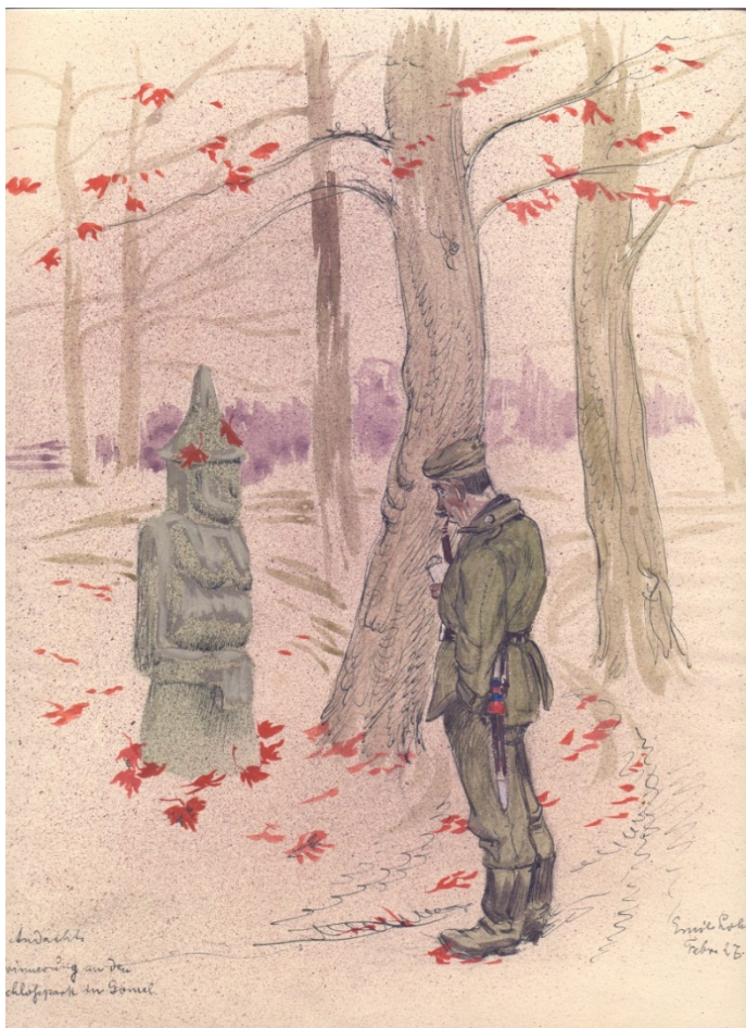
Э. Лозе «Воспоминание о гомельском парке», Германия, 1927 г., акварель, // МГДПА